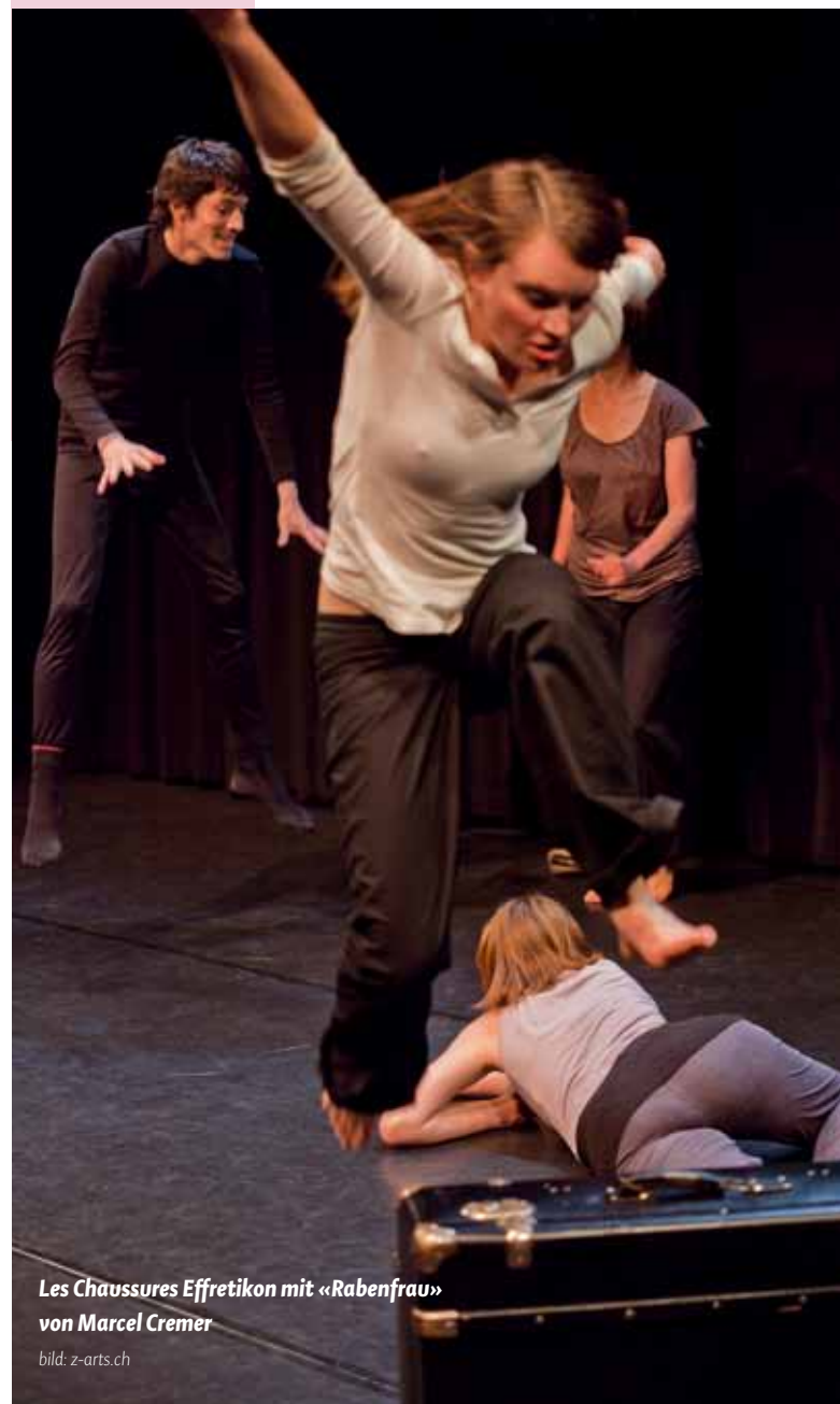
Les Chaussures Effretikon mit «Rabenfrau» von Marcel Cremer