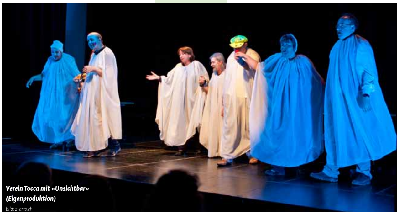
Verein Tocca mit «Unsichtbar» (Eigenproduktion)